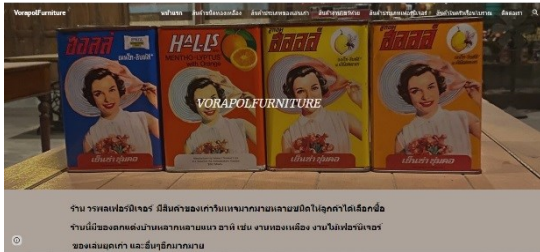
ภาพที่ 1 หน้าแรกของเว็บไซต์

จากตารางที่ 3.1 จะเห็นได้ว่า ระดับความพึงพอใจของอาสาสมัครที่ทดลองใช้งานเว็บไซต์สำหรับการขายสินค้าวินเทจ กรณีศึกษาร้าน วรพลเฟอร์นิเจอร์ โดยภาพรวมอยู่ที่ค่าเฉลี่ยอยู่ในระดับมากที่สุด (4.68)