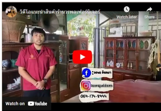
ภาพที่ 2 วิดีโอแนะนำ